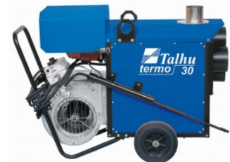
TALHU Termo 30

Vuokraus 040-861 6499 (ma-pe klo 7-15.30)